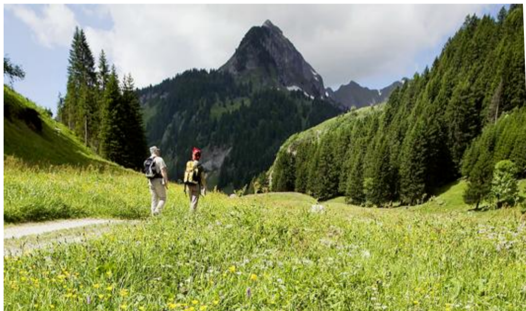
Le Vanil-Noir est un sommet emblématique pour les Fribourgeois. C'est aussi une réserve naturelle, les promeneurs sont invités à ne pas s'écarter des sentiers balisés. Les chalets témoignent encore d'une activité agricole. En médaillon: José Collaud, responsable de la réserve.