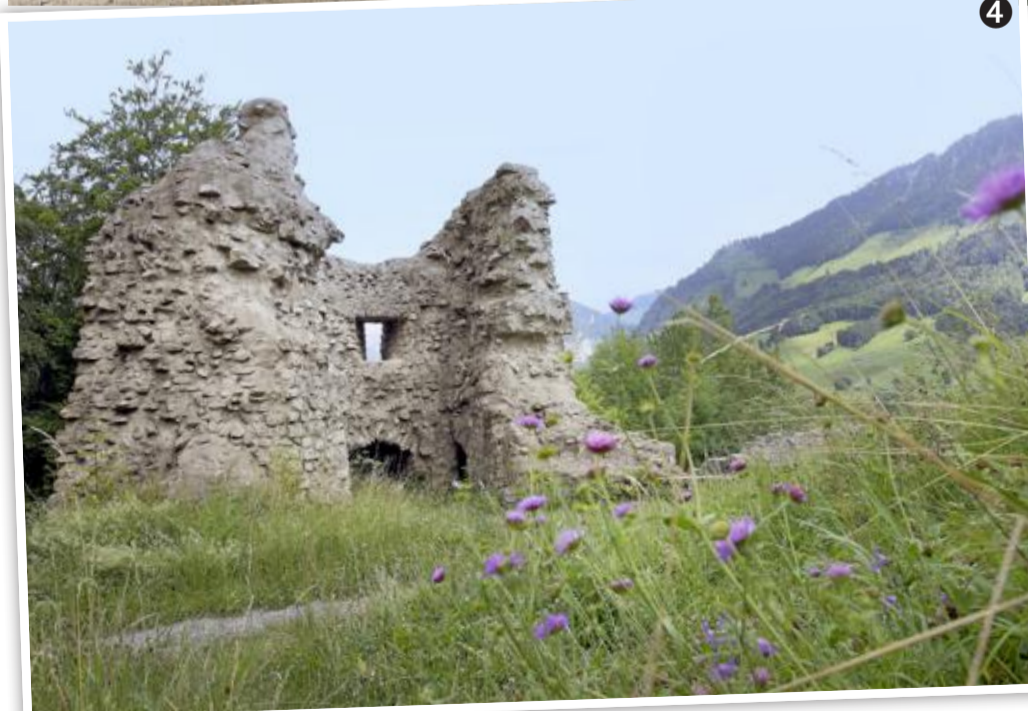
1 Au milieu du tunnel, passe la plus étroite des gorges, une ouverture permet un premier regard sur la Jogne. 2 Des passerelles sécurisent la promenade. 3 Une place de pique-nique se trouve juste après le barrage. On constate le niveau très bas du lac de Montsalvens. 4 Le château de Montsalvens a été construit au XII e siècle. Il est tombé en ruine au XVII e siècle.